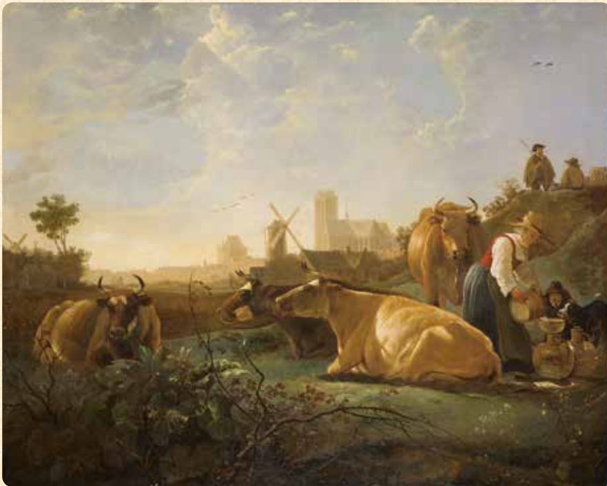
A. Cuyp. Gezicht op Dordrecht met vee en een melkmeid ('The Large Dordt'), ca. 1650, The National Gallery, Londen

Aelbert Cuyp woonde en werkte zijn hele leven in Dordrecht. Zijn opdrachtgevers bestonden voornamelijk uit rijke Dordtse aristocratie en hij schilderde de stad tientallen keren. Nog steeds ademt de stad de sfeer van de Hollandse 17de eeuw en kun je rondlopen in het Dordrecht van Aelbert Cuyp.