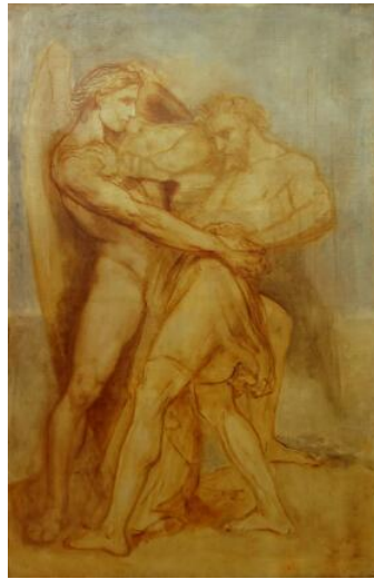
Ary Scheffer, Jacob en de engel , 1856 - 1858