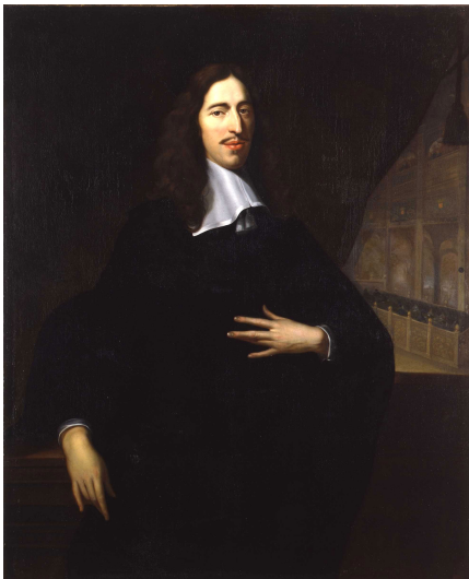
Jan de Baen, Portret van Johan de Witt, 1669

Deze twee staatsieportretten door de Haagse schilder Jan de Baen zijn verreweg het bekendst. Johan de Witt (1625-1672) liet zich hier portretteren als een zelfbewust staatsman - de machtigste man in de Republiek - met op de achtergrond de vergaderzaal van de Staten van Holland ( nu de eerste kamer), die onder zijn leiding was verbouwd.