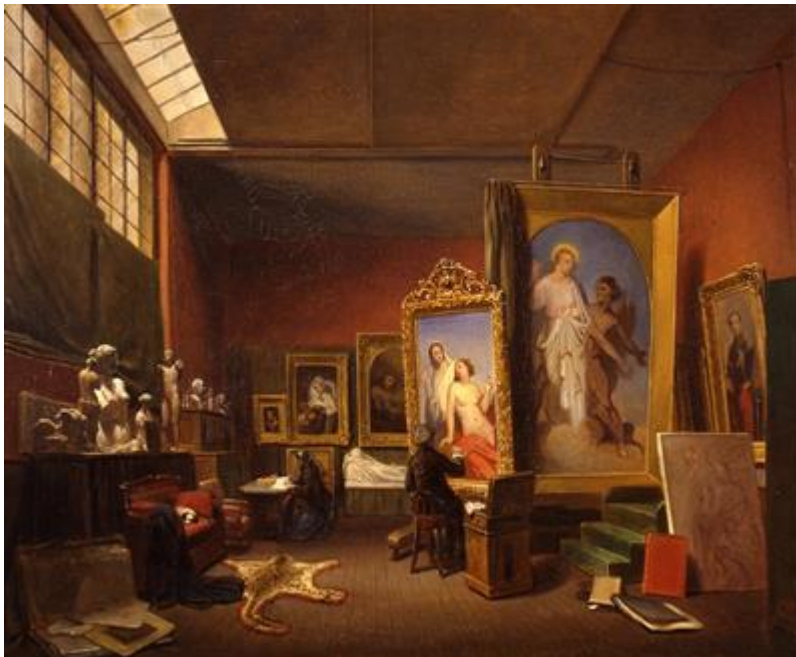
Ary Lamme, Ary Scheffer aan het werk in het grote atelier, 1851

Ary Scheffer had net als andere schilders een eigen atelier. Een atelier is een plek waar de kunstenaar werkt. In deze zaal zie een schilderij van zijn atelier.