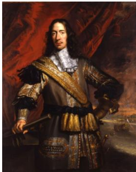
Jan de Baen, Portret van Cornelis de Witt, 1669

Waarom kan je zien dat de portretten bij elkaar horen?