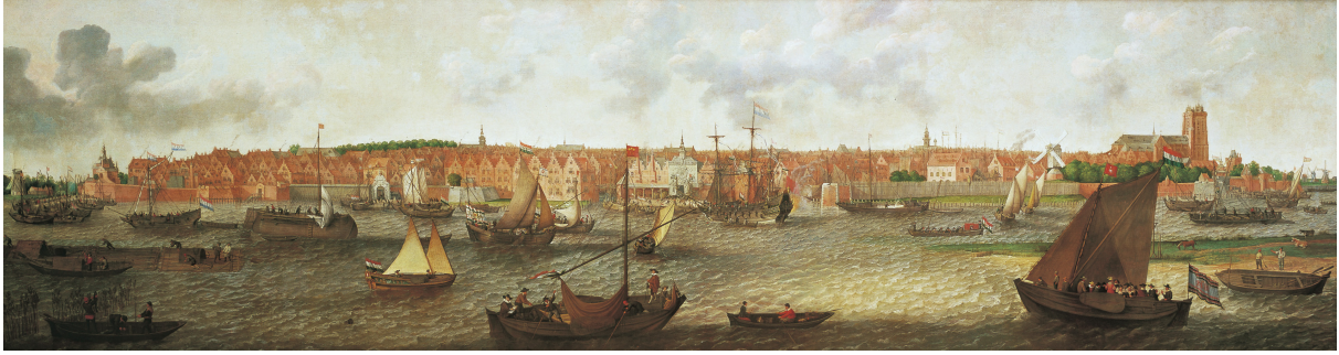
Adam Willaerts, Gezicht op Dordrecht vanuit de monding van de Noord, 1629

Dit is het grootste schilderij dat ooit van de stad Dordrecht is gemaakt. Vreemd genoeg is het gemaakt door iemand uit Utrecht.