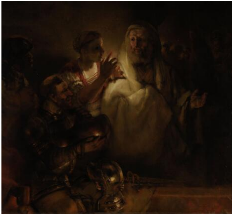
Rembrandt van Rijn, De verloochening van Petrus , 1660

Rembrandt van Rijn werd geboren in Leiden. Hij werd schildersleerling in Leiden en Amsterdam. Na zijn schilderopleiding schilderde Rembrandt veel bijbeltaferelen in een precieze stijl met bonte kleuren. Veel leerlingen van Rembrandt waren beroemde schilders en kwamen uit Dordrecht. Zoals Ferdinand Bol, Nicolaes Maes en Arent de Gelder. Nergens anders zou de stijl van Rembrandt zo lang populair blijven als in Dordrecht.