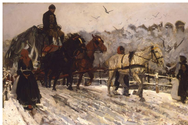
George Hendrik Breitner, Sleperspaarden in de sneeuw , 1890