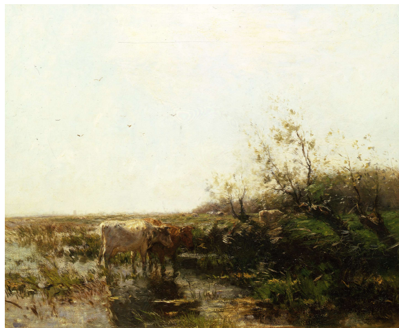
Willem Maris, Zomer , 1897

Ga naar het schilderij Zomer van Willem Maris.