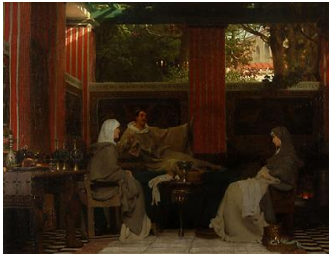
Lourens Alma Tadema, Venantius Fortunatus draagt zijn verzen voor , 1862

Bekijk dit schilderij van Lourens Alma Tadema en lees het bijbehorende tekstbordje. Waarom is dit schilderij een goed voorbeeld van romantische kunst?