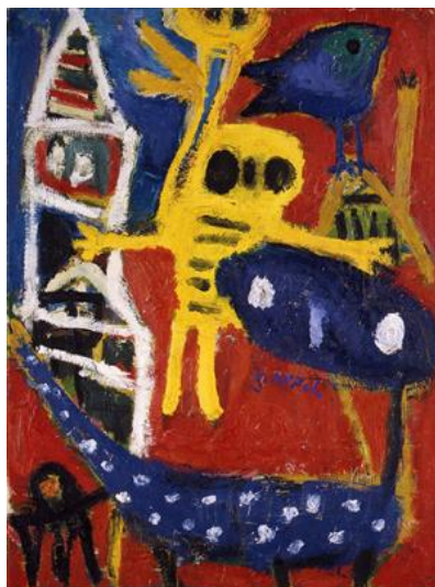
Karel Appel, Kindje, Kerkje, Beestje , 1949