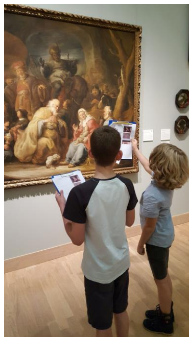
Kinderen tijdens een rondleiding