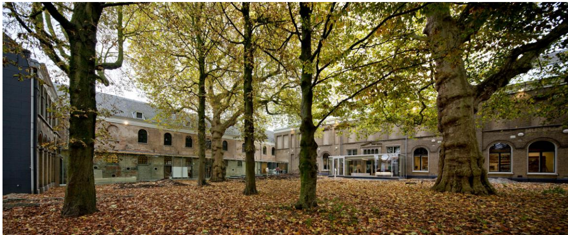
Dordrechts Museum, foto vanuit de tuin