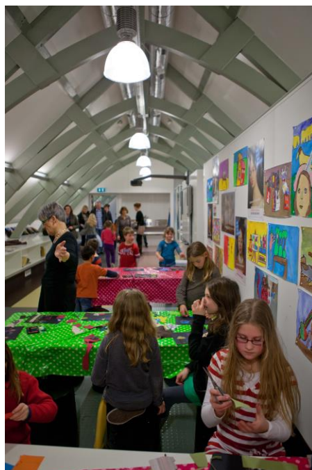
Het atelier in het Dordrechts Museum