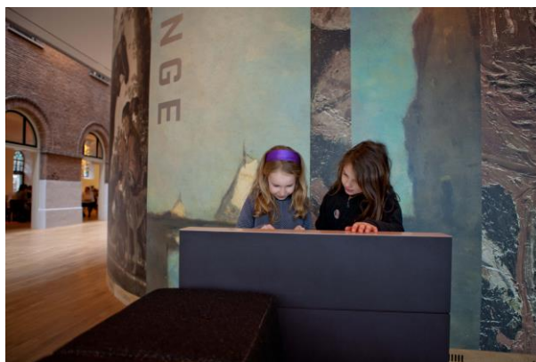
Kinderen in de lounge van het museum

Waar mogelijk worden daarbij onderwerpen gebruikt die samenhangen met die uit andere leergebieden. Het onderwijs wordt daardoor meer samenhangend en mede daardoor betekenisvoller voor leerlingen. Maar voorop staat natuurlijk de authentieke bijdrage van kunstzinnige oriëntatie aan de ontwikkeling van kinderen.