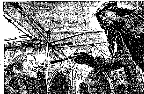
Levende standbeelden sieren de nieuwe ingang van het museum op.

Staatssecretaris Halbe Zijlstra spreekt tijdens de opening van het museum over cultureel ondernemerschap en marketing. Het Dordrechts Museum heeft dat volgens de staatssecretaris prima in orde. „Dit sluit precies aan bij de gedachten van dit kabinet over het cultuurbeleid.”