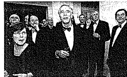
De stichting Vrienden van het Museum kwam vrijdagavond bij elkaar om het museum een schilderij te schenken.

Nog nooit waren de verwachtingen zo hoog gespannen, vond Zijlstra. Hoe zou het er nu uitzien? „Dit is moderne marketing. Jullie zeggen: het is geen museumbezoek, maar een museumbelevenis.” Directeur Schoon sneed dat ook