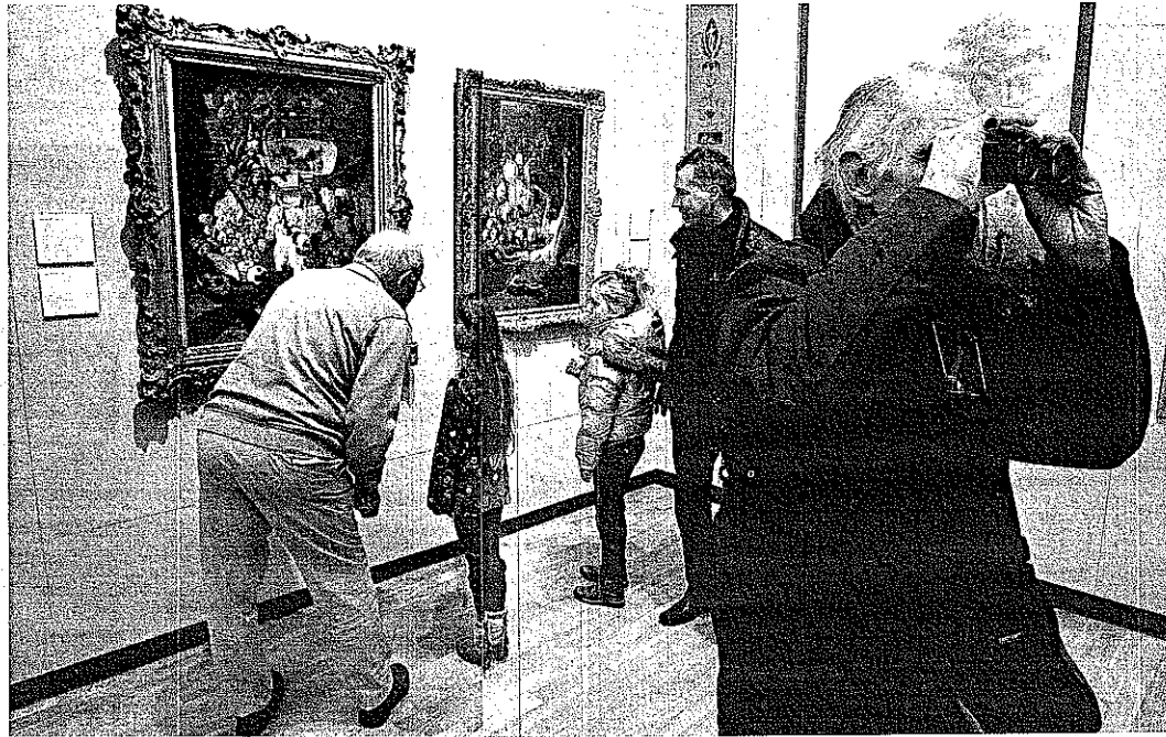
Jong en oud liep gistermiddag uit om de kunst in het heropende Dordrechts Museum te bekijken. Het museum was speciaal voor de opening gratis toegankelijk.

Een Dordtenaar bergt snel zijn camera weer op. „Helaas,” mompelt hij zachtes. „Ach, ik weet toch dat ik hier zeker weer terug zal komen om van al dit moois te genieten. Ja, dit is prachtig gedaan. Het is het jarenlange wachten meer dan waard geweest.”